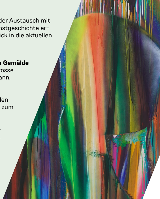
Abb.: Katharina Grosse, o.T., 2019, Courtesy: Privatsammlung, Foto: Jens Ziehe; © VG Bild-Kunst, Bonn 2024

Auch das Zirkustheater StandART ist am Sonntag wieder dabei und begeistert mit Kunststücken, Jonglage und Mitmach-Programm.